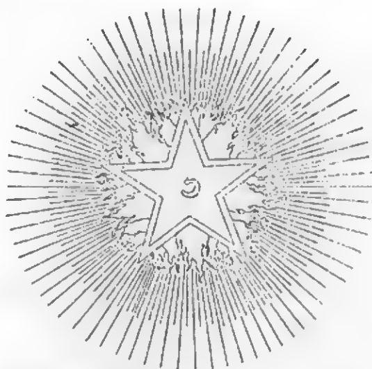
Estrela flamejante dos templos maçônicos, segundo a obra de Henri Durville.

e na justiça. Um dos raios volvido para a altura, dois apontando os Pólos, dois assinalando os membros inferiores, indicam a Inteligência dominando os Instintos, a Vontade dominando os Elementos, a Matéria Imponderável dominando a Matéria Ponderável. Pentáculo de Alta Magia (36)! O mesmo símbolo do Bafomet, Bode Preto das lojas. O G que aparece no meio da ESTRELA FLAMÍGERA ou FLAMEJANTE quer dizer GNOSE, Sabedoria. "A letra G, gravada ou incrustada na ESTRELA que se vê nos Templos é, para o companheiro, a inicial da palavra Geometria , a quinta das ciências; foi substituída pelos maçons do Rito Moderno ao IOD dos hebreus ou primeira letra da palavra JEOVÁ. O IOD significa princípio na interpretação cabalística. Para os Mestres conserva a significação natural, a idéia, a imagem, o nome de Deus (37)." "A ESTRELA FLAMEJANTE que se vê nos Templos Maçônicos — revela um ex-maçom — traz no meio a letra G. Faz-se crer aos Iniciados que é a primeira letra da palavra inglesa GOD, Deus. Mas aos verdadeiros eleitos , aos Kadoschs, grau 30, se explica que significa GNOSE. A maçonaria é, portanto, a herdeira direta da GNOSE (38)!"